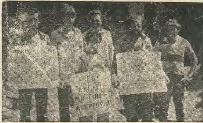
Οι απεργοί οικοδόμοι του Σ. Ράφτη

Αποτέλεσμα αυτής της στάσης της εργοδοσίας ήταν οι 30 οικοδόμοι να κατέλ-