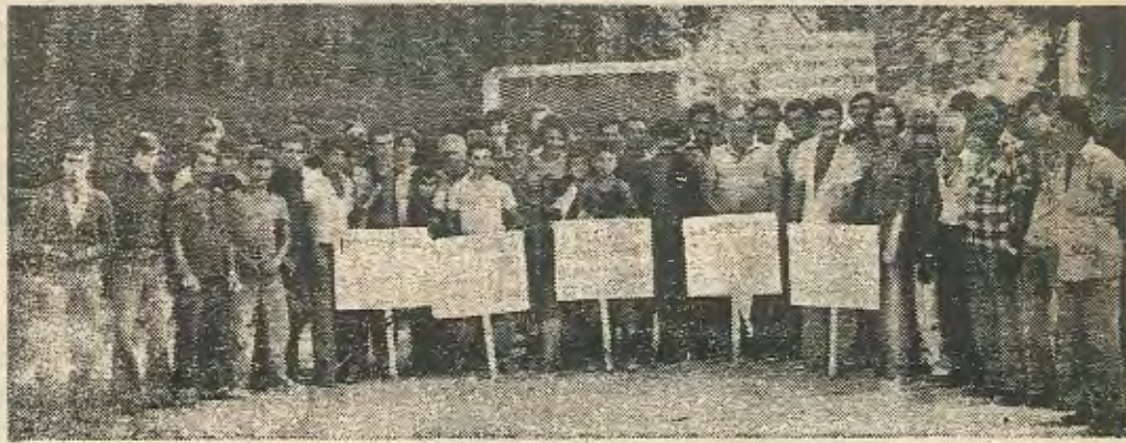
Αναβάτες και σταυλίτες του Ιπποδρόμου

Ιδιοκτητών σχετικά με την αφαίμαξη των τροφών των αλόγων.